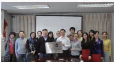
中国传媒大学基地