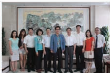
李劲松总裁陪同韩国国会议员 咸珍圭夫妇访问沈阳大学