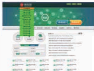
韩国15家孔子学院-唐风汉语 HSK纸网考一体化服务平台