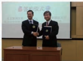
唐风汉语与韩国15家孔子学院 签署合作协议