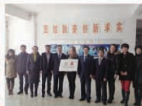
大连海洋大学基地